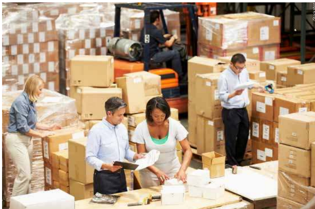
Gelieferte Waren sollten beim Eingang gleich kontrolliert werden – sonst kann es später teuer kommen.

Wenn Produkte Mängel aufweisen, kann das zu grossen finanziellen Verlusten für ein Unternehmen führen. Es ist daher eine gute Idee, dass sich Führungspersonen rechtzeitig mit dem Thema Sachgewährleistung auseinandersetzen - Schadenersatz für mangelhafte Lieferungen gibt es nämlich nicht in jedem Fall.